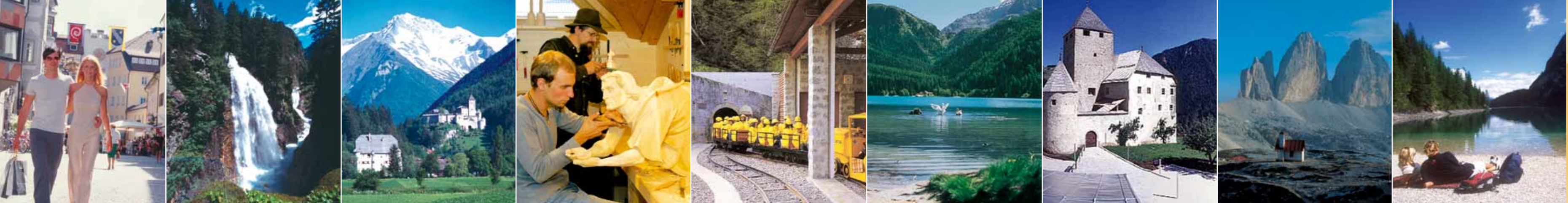
1 Bruneck 2 Reinbachwasserfälle, Rein 3 Schloss Taufers, Sand in Taufers 4 Krippenmuseum, Luttach 5 Bergwerk, Prettau 6 Antholzer See 7 Schloss Thurn, St. Martin 8 Drei Zinnen 9 Pragser Wildsee