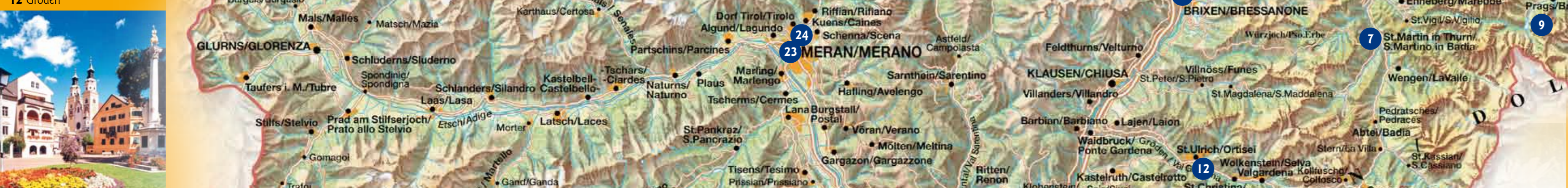
14 Kloster Neustift, Brixen 15 Erdpyramiden, Ritten