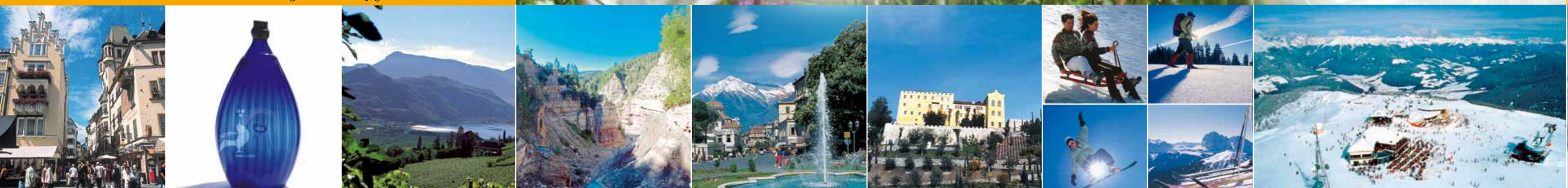
20 Weinmuseum, Kaltern 21 Kalterer See 22 Bleterbachschlucht, Aldein