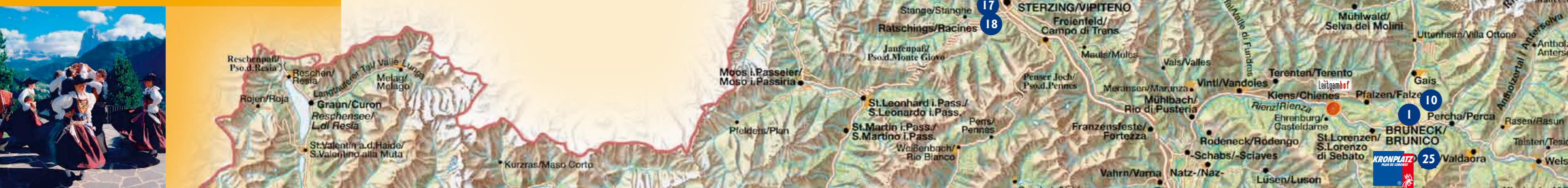
12 Gröden 13 Brixen