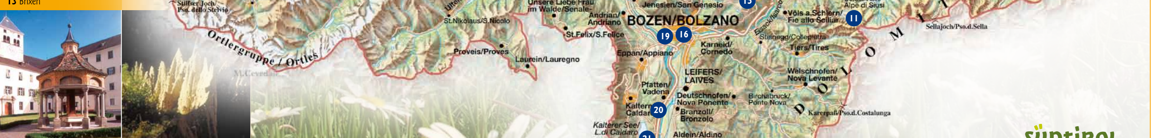
16 Ötzi-Museum, Bozen 17 Gilfenklamm, Sterzing