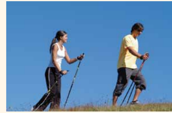
Noleggio racchette Nordic Walking alla Reception

Una passeggiata attraverso una gola stretta, che passa sotto il Castello di Scaunia e davanti ad un monumento naturale, un abete estremamente raro... Totale ore di cammino: ca 4 ore Grado di diff.: nessuna difficoltà, possibilità di ristoro lungo il percorso Suggerimento: passeggiata interessante per gli amanti della natura, flora molto varia, è possibile visitare la distilleria di olio di pino mugo ed il giardino d'erbe.